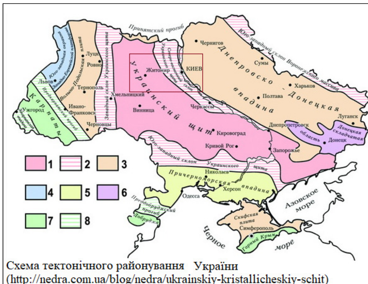
Рис.2.2. Схематичне розташування території Щиглівського старостинського округу Житомирської області в межах Українського кристалічного щита.

напрямку. Абсолютні відмітки змінюються в межах від 186,74 м до 171,95 м в Балтійській системі висот.