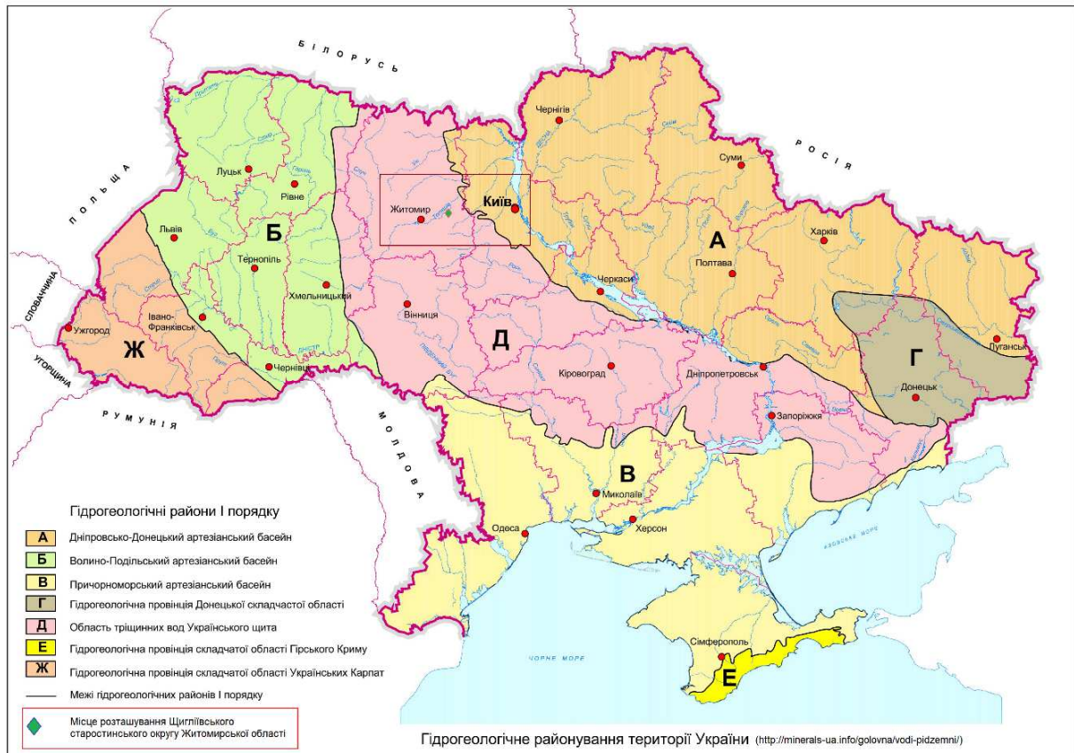
Рис.2.3. Схематичне розташування території Щиглівського старостинського округу Житомирської області в межах області тріщинних вод Українського щита.

формування значних об'ємів водних ресурсів, обводнення водоносних порід по площі і на глибину вкрай нерівномірне. Підземні води містяться, як у тріщинуватій зоні кристалічних порід докембрію, так і у осадових відкладах, що виповнюють заглиблення у кристалічному фундаменті. Зона активного водообміну підземних вод складає 100-150 м. Тріщинуваті породи розвинуті повсюдно, але вони відзначаються різним ступенем тріщинуватості, що обумовлює нерівномірне обводнення. Водоносність осадових відкладів, які розвинуті переважно на вододільних територіях, має локальний характер. Ці породи характеризуються неглибоким заляганням, що нерідко призводить до погіршення якості підземних вод (рис.2.3.).