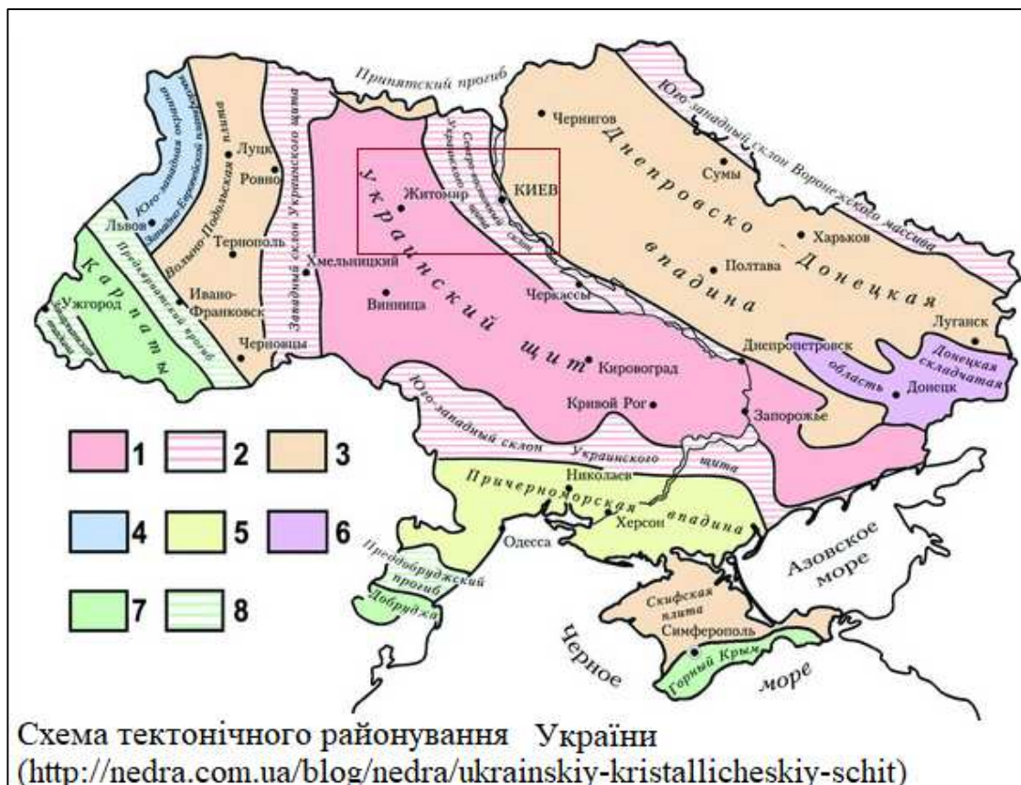
Рис.2.2. Схематичне розташування території Щиглівського старостинського округу Житомирської області в межах Українського кристалічного щита.

Виходи на поверхню архейсько-протерозойського комплексу найчастіше спостерігається по долинах річок. У геологічній будові приймають участь докембрійські кристалічні породи, продукти їх вивітрювання, палеогенові та четвертинні відкладення. Породи фундаменту представлені нижньо-верхньопротерозойськими гнейсами, кіровоградсько-житомирськими, осницькими і коростенськими гранітами, мігматитами, гранодіоритами, діабазами, кварцитами і піщаниками Овруцької серії. Глибина залягання гранітів сягає 1500-2000 м. Мезозойські і палеозойські породи поширені обмежено у зниженнях, зате повсюдно поширені малопотужні осадові відклади четвертинного часу.