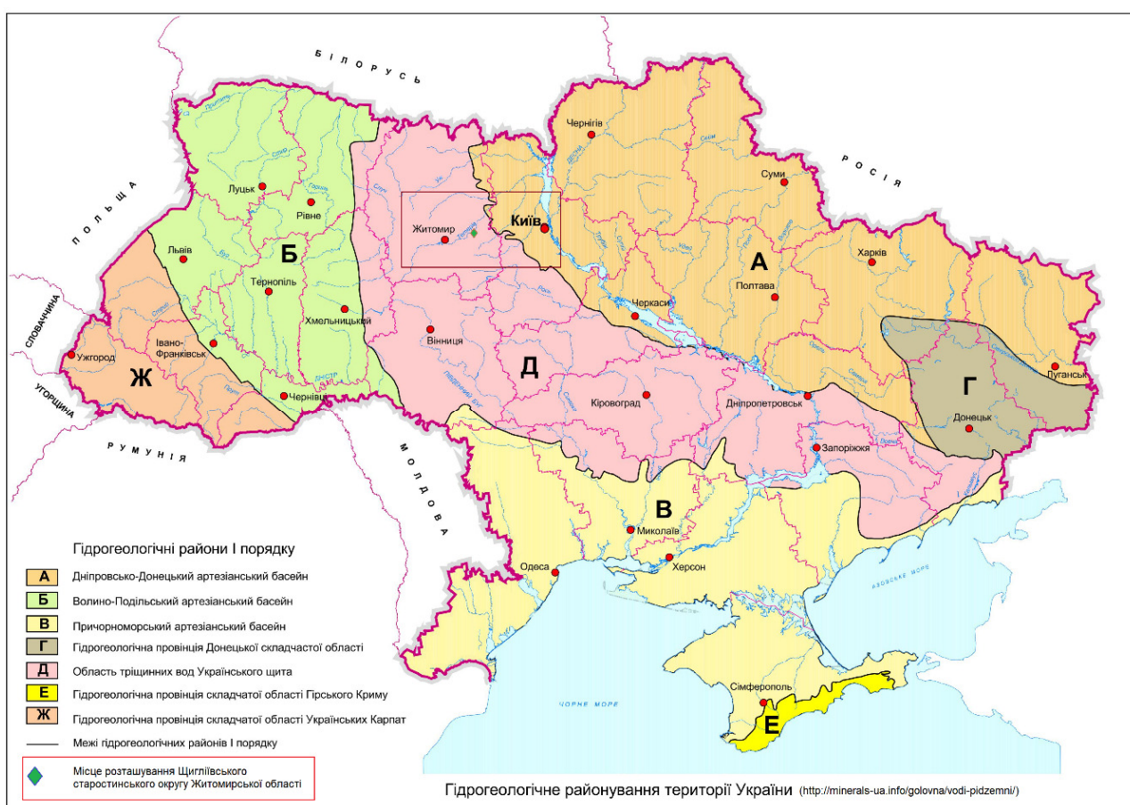
Рис.2.3. Схематичне розташування території Щиглівського старостинського округу Житомирської області в межах області тріщинних вод Українського щита.

Територія села Семенівка знаходиться в межах області тріщинних вод Українського щита [Мінеральні ресурси України – Ресурс розміщення: http://minerals-ua.info/golovna/vodi-pidzemni/ ], яка розташована в центральній частині України у межах великого підняття стародавнього кристалічного фундаменту і охоплює територію Житомирської, Вінницької, Кіровоградської, східну частину Житомирської, південні частини Київської і Дніпропетровської, південно-західну частину Черкаської, північні окраїни Одеської і Миколаївської, а також північно-східну частину Запорізької областей. Гідрогеологічні умови накопичення і циркуляції підземних вод у басейні несприятливі для формування значних об'ємів водних ресурсів, обводнення водоносних порід по площі і на глибину вкрай нерівномірне. Підземні води містяться, як у тріщинуватій зоні кристалічних порід докембрію, так і у осадових відкладах, що виповнюють заглиблення у кристалічному фундаменті. Зона активного водообміну підземних вод складає 100-150 м. Тріщинуваті породи розвинуті повсюдно, але вони відзначаються різним ступенем тріщинуватості, що обумовлює нерівномірне обводнення. Водоносність осадових відкладів, які розвинуті переважно на вододільних територіях, має локальний характер. Ці породи характеризуються неглибоким заляганням, що нерідко призводить до погіршення якості підземних вод (рис.2.3.).