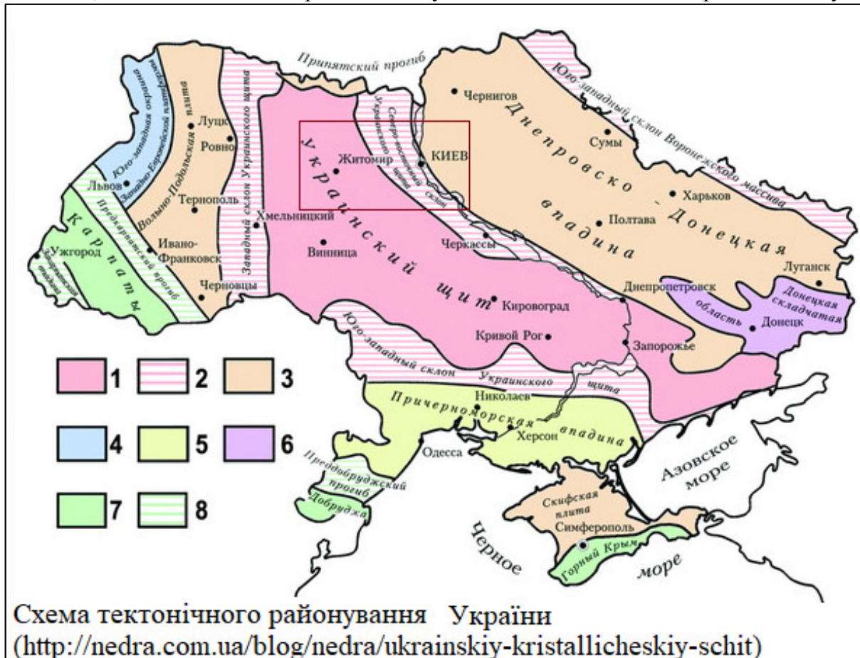
Рис.2.2. Схематичне розташування території Щиглівського старостинського округу Житомирської області в межах Українського кристалічного щита.

кристалічні породи, продукти їх вивітрювання, палеогенові та четвертинні відкладення. Породи фундаменту представлені нижньо-верхньопротерозойськими гнейсами, кіровоградсько-житомирськими, осницькими і коростенськими гранітами, мігматитами, гранодіоритами, діабазами, кварцитами і піщаниками Овруцької серії. Глибина залягання гранітів сягає 1500-2000 м. Мезозойські і палеозойські породи поширені обмежено у зниженнях, зате повсюдно поширені малопотужні осадові відклади четвертинного часу.