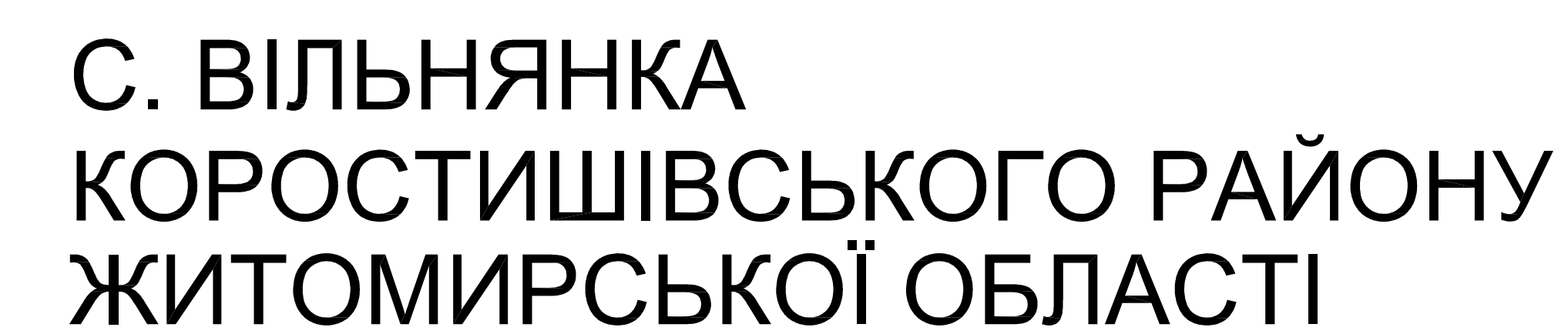
СХЕМА ІНЖЕНЕРНОЇ ПІДГОТОВКИ ТА ЗАХИСТУ ТЕРИТОРІЇ